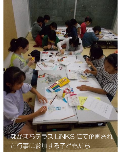
なかまちテラス LiNKs にて企画された行事に参加する子どもたち

仲町図書館ではその他にも自動貸出機や貸出ロッカー等、独自のサービスも実施しています。詳しくはお問い合わせください。