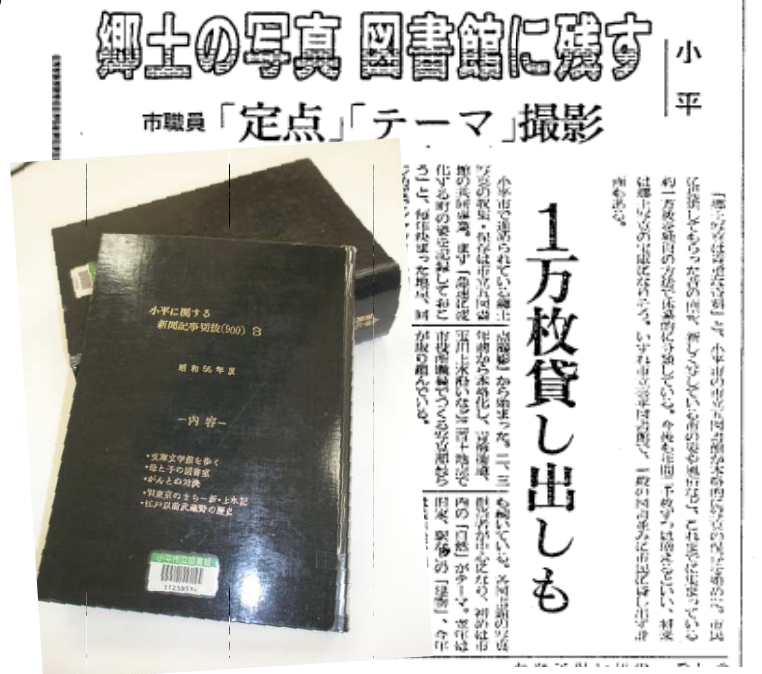
昭和57年8月11日の新聞記事切り抜き