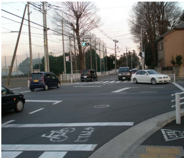
平成 21(2009)年 1 月 8 日 撮影

新小金井街道（府中清瀬線）のうち、青梅街道から東京街道までが平成 18 年 3 月 26 日に開通し、甲州街道から清瀬市の小金井街道までつながりました。