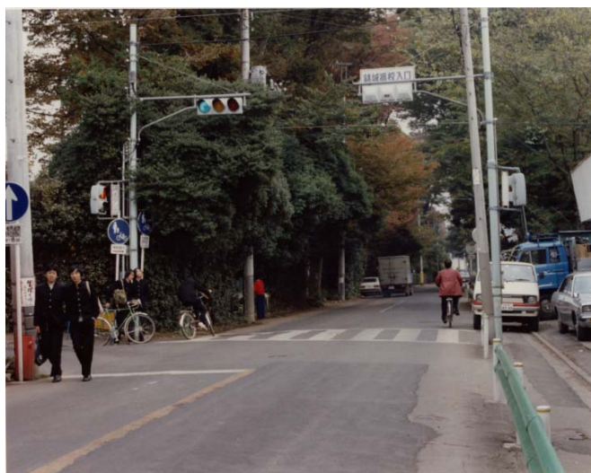
昭和 57(1982)年 10 月 29 日 撮影

新小金井街道（府中清瀬線）のうち、青梅街道から東京街道までが平成 18 年 3 月 26 日に開通し、甲州街道から清瀬市の小金井街道までつながりました。