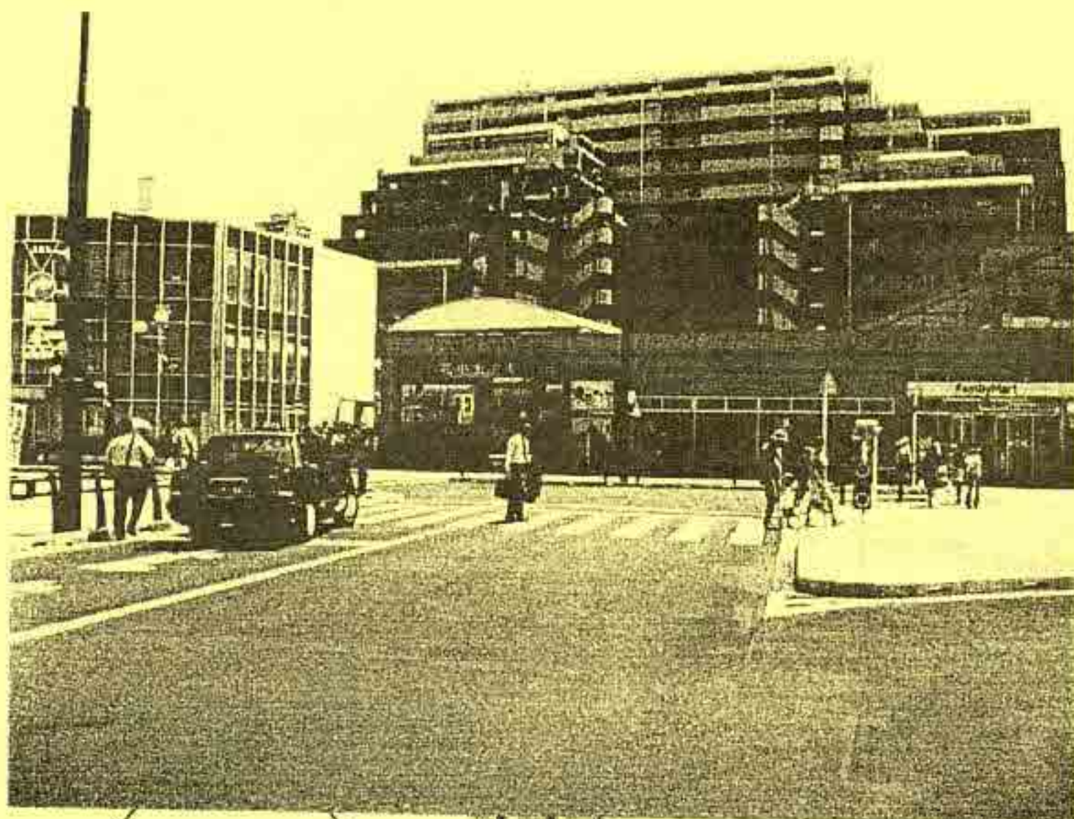
現在(平成18年)◇新装した北口駅周辺

発行・小平市立図書館 平成19年1月 問合せ・小平市中央図書館 〒187-0032 小平市小川町2-1325 TEL 042-345-1246