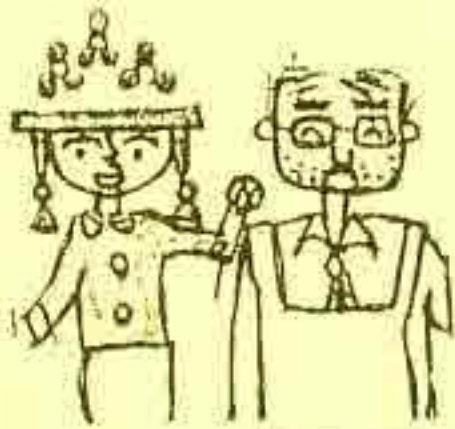
3階 読書室（おはなし室）